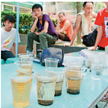
经电解后变色的水